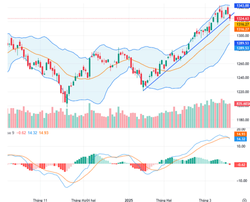
Phái sinh VN30F1M